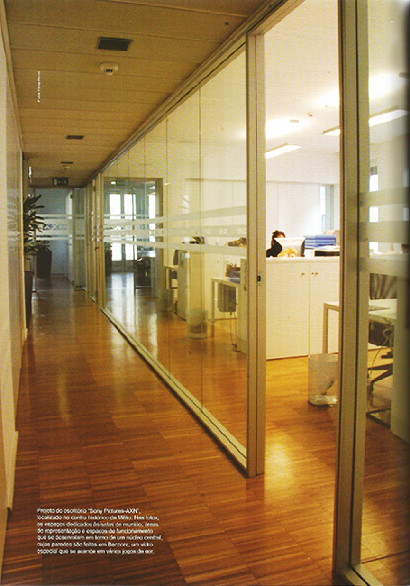
Projeto do escritório "Sony Pictures-AXN", localizado no centro histórico de Milão. Nestes locais, os espaços dedicados às salas de reunião, áreas de representação e espaços de funcionamento que se desenvolvem em torno de um núcleo central, cujas paredes são feitas em Bencore, um vidro especial que se acende em vários jogos de cor.