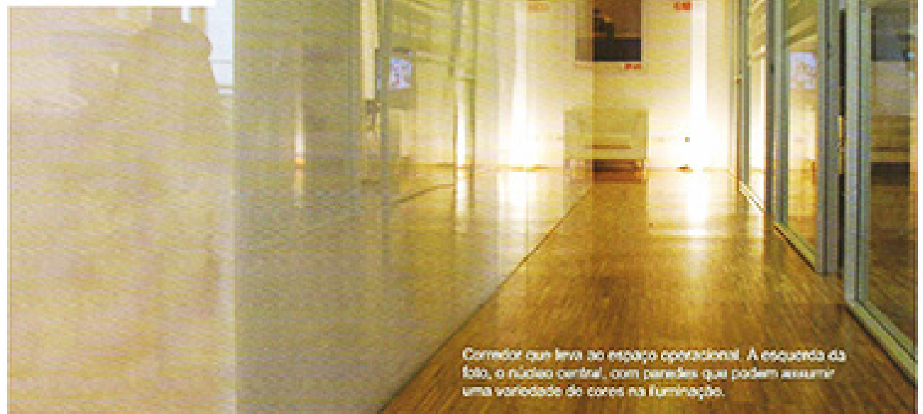
Corredor que leva ao espaço operacional. À esquerda da foto, o núcleo central, com paredes que podem assumir uma variedade de cores na iluminação.