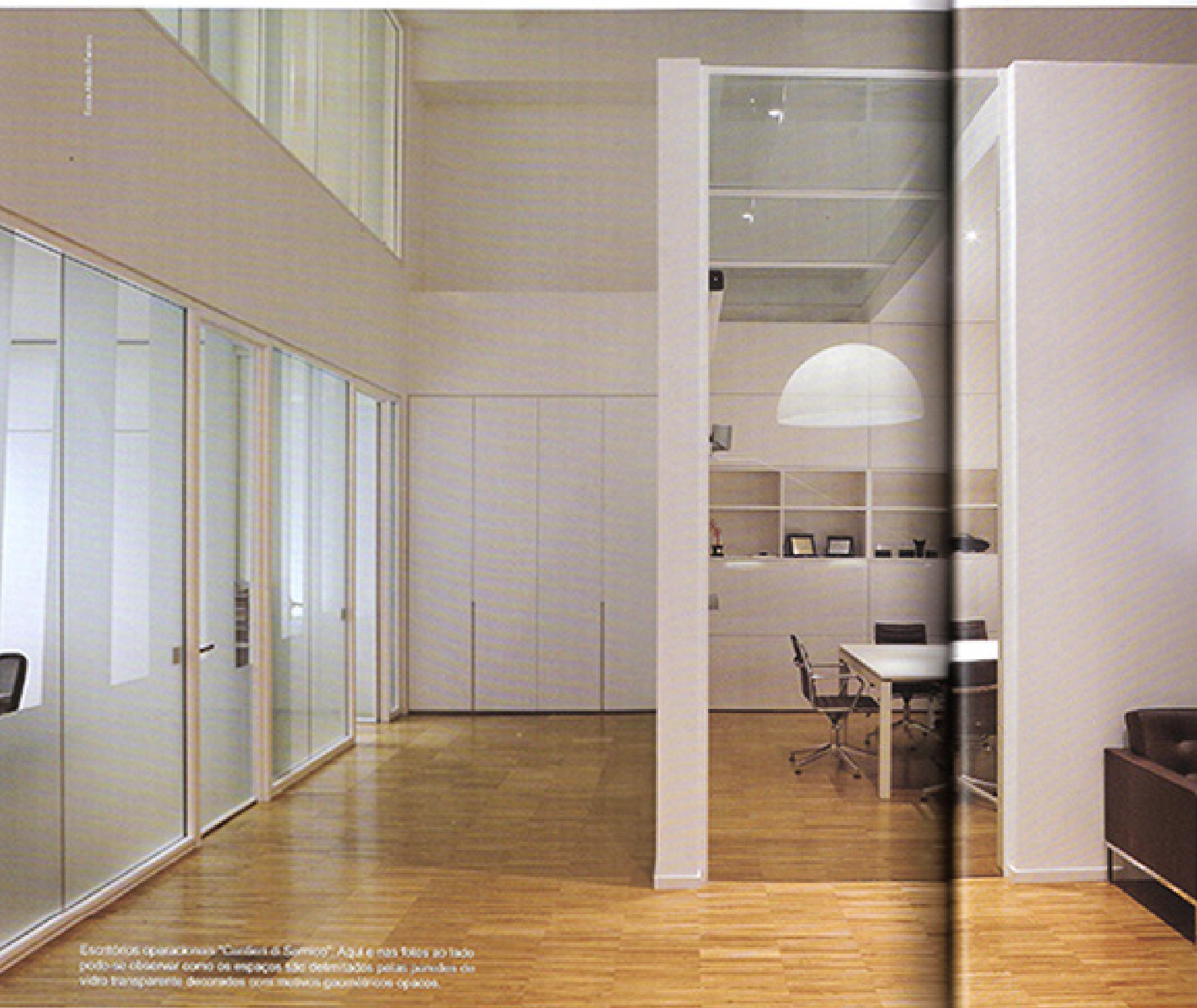
Escritórios operacionais "Casalini di Spino". Aqui e nas fotos ao lado pode-se observar como os espaços são delimitados pelas juntas do vidro transparente, decoradas com motivos geométricos opacos.

os locais de trabalho poderiam ser ampliados de forma harmoniosa: para isso ele reparte, sempre que possível, as paredes ou substitui o vidro, criando novas comunicações entre os ambientes.