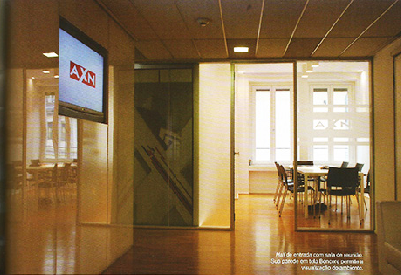
Hall de entrada com sala de reunião. Sua parede em tãla Bencore permite a visualização do ambiente.